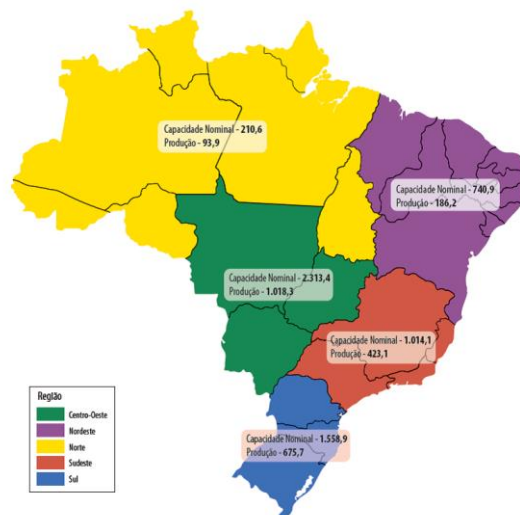
Figura 1 – Capacidade nominal e produção de biodiesel por regiões (mil m³/ano) - 2010.

Nacional de Fortalecimento da Agricultura Familiar (Pronaf) e do Banco Nacional de Desenvolvimento Econômico e Social (BNDES), que oferece financiamento para 90% do valor dos projetos voltados à produção do biocombustível.