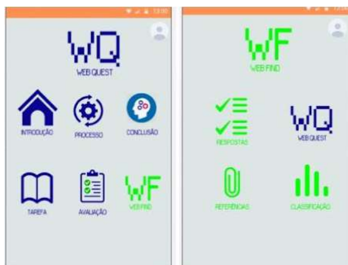
Figura 2. Tela de Visualização da WQ (à esquerda) e Visualização de uma WF (à direita)

A próxima tela apresentada na porção esquerda da figura 2 apresenta uma WQ já criada sendo acessada. A opção WF é apresentada para o usuário, que ao ser selecionada, direciona o usuário para a produção de uma WF (direita da Figura 2) tornando a associação possível entre as ferramentas. A parte direita da figura 2 também apresenta a opção WQ, que possui a tarefa correspondente a WF criada, a classificação apresenta a avaliação da WF pelo professor criador da WQ associada.