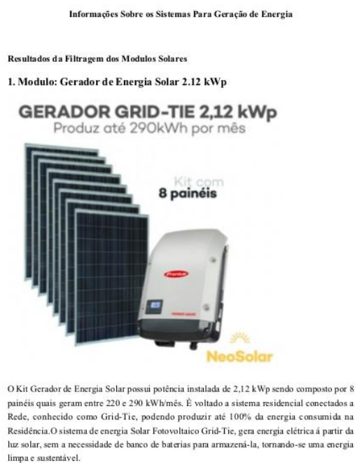
Figura 4 – Relatório Gerado Parte 1

O relatório gerado terá dados sobre os módulos que foram filtrados no banco de dados, de acordo com a consulta realizada. O documento iniciará pelo nome ou identificação do modulo seguido de uma imagem especificando visualmente alguns de seus componentes com uma descrição rápida desses componentes logo abaixo da imagem, explicitando algumas de suas características (Figura 4). Na próxima parte do documento tem-se uma tabela que explicita as principais características do modulo, sendo são elas: nome, inversor, potência, quantidade de módulos, eficiência, área ocupada, inclinação e preço do componente. Para finalizar é apontada uma estimativa de consumo que tem base na potência do equipamento, a aplicação aproveitará essa potência em três estados diferentes, o primeiro será a potência dividida por dois, o segundo a própria potência e o terceiro a soma dos dois primeiros, esses três valores serão usados como consumo médio do usuário para que seja possível realizar uma estimativa de consumo diferente para cada caso (Figura 5).