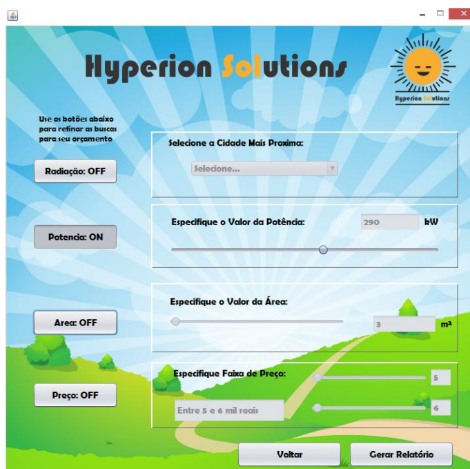
Figura 3 – Tela para novo Relatório

Ao selecionar a opção de “Novo Relatório” a aplicação será redirecionada para uma nova tela, apresentada na Figura 3: